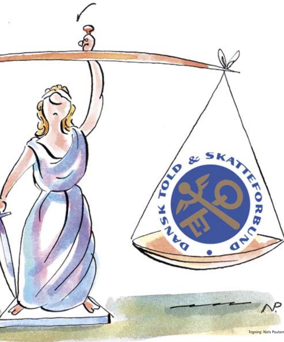
Tegning: Niels Poulsen

teneste, er der så nogen grænse for, hvor langt fra det oprindelige ansættelsessted de er forpligtede til at lade sig forflytte.