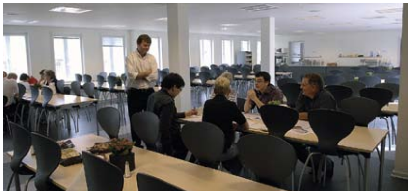
Kantinen - som resten af BetalingsCentret indrettet i den gamle Amtsgård.