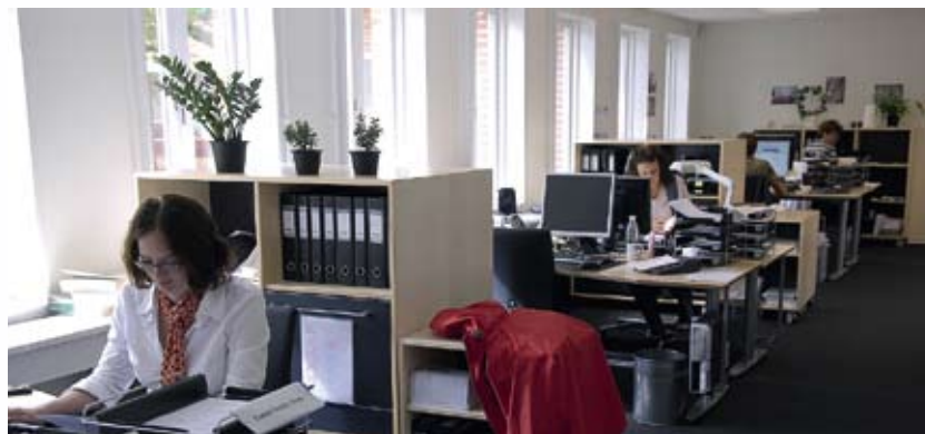
Et af kontorerne - alle, bortset fra chefen, sidder i storrum.