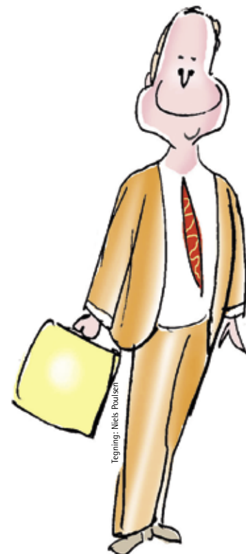
Tegning: Niels Poulsen

Så er det, man - mens øjnene er lukkede og luften langsomt pustes ud - hører den lille stemme, der som i "Kejserens Klæder" tør rive glansbilledet i stykker og sætte ord på den virkelighed, alle de andre med høje stemmer fortier.