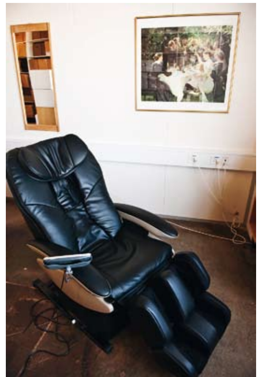
Den nyindkøbte massagestol, som dårligt er nået at komme i brug.