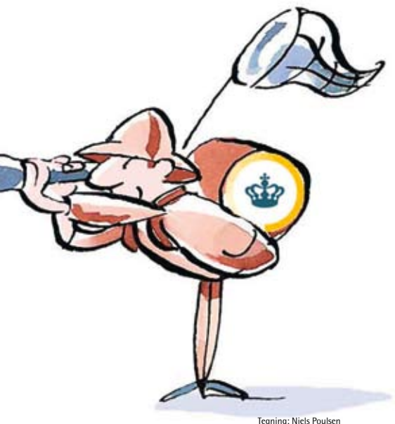
Tegning: Niels Poulsen