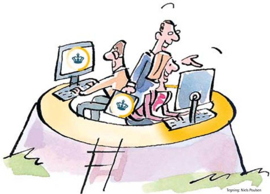
Tegning: Niels Poulsen

SKAT-bibliotekets ypperstepræstinde, sprogbetjenten der kapper alle gryffer ud inden udgivelse, S-toget frem og tilbage mellem Nicolai Eigtveds Gade og Østbanegade – det hele i udfordrende samspil med – ja lige netop – kerneyderne .