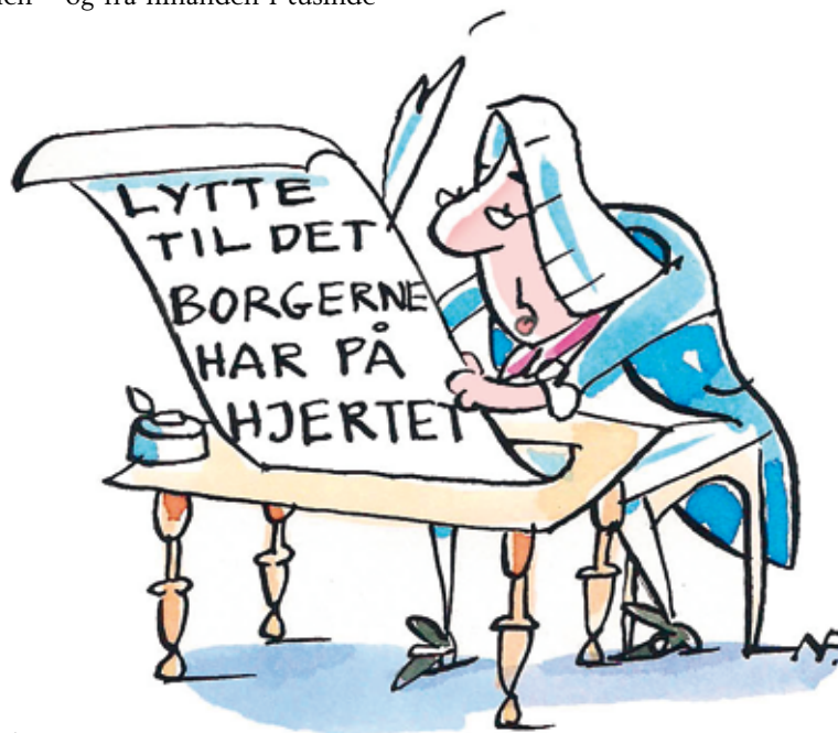
Tegninger: Niels Poulsen

For uden det, vil kejserens mægtige rige falde sammen – og fra hinanden i tusinde stykker.