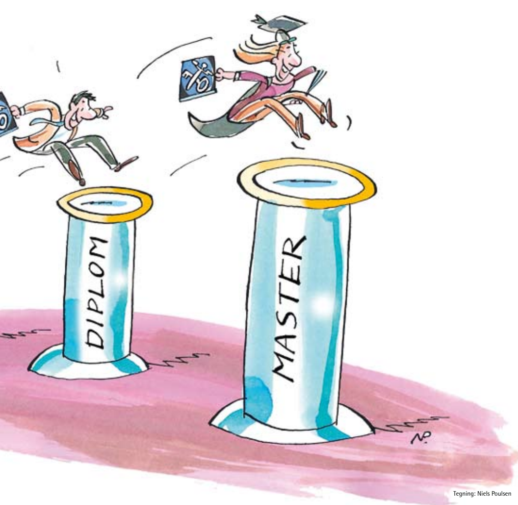
Tegning: Niels Poulsen

inddrivelse og skat. Udbyttet af uddannelserne skal på VVU-niveau være grundlæggende kompetence indenfor mindst et af Skatteministeriets lovområder. På diplomuddannelsen er udbyttet brede kompetencer på de valgte lovområder - og masteruddannelsen skal give et udbytte i specialistkompetencer på de valgte lovområder.